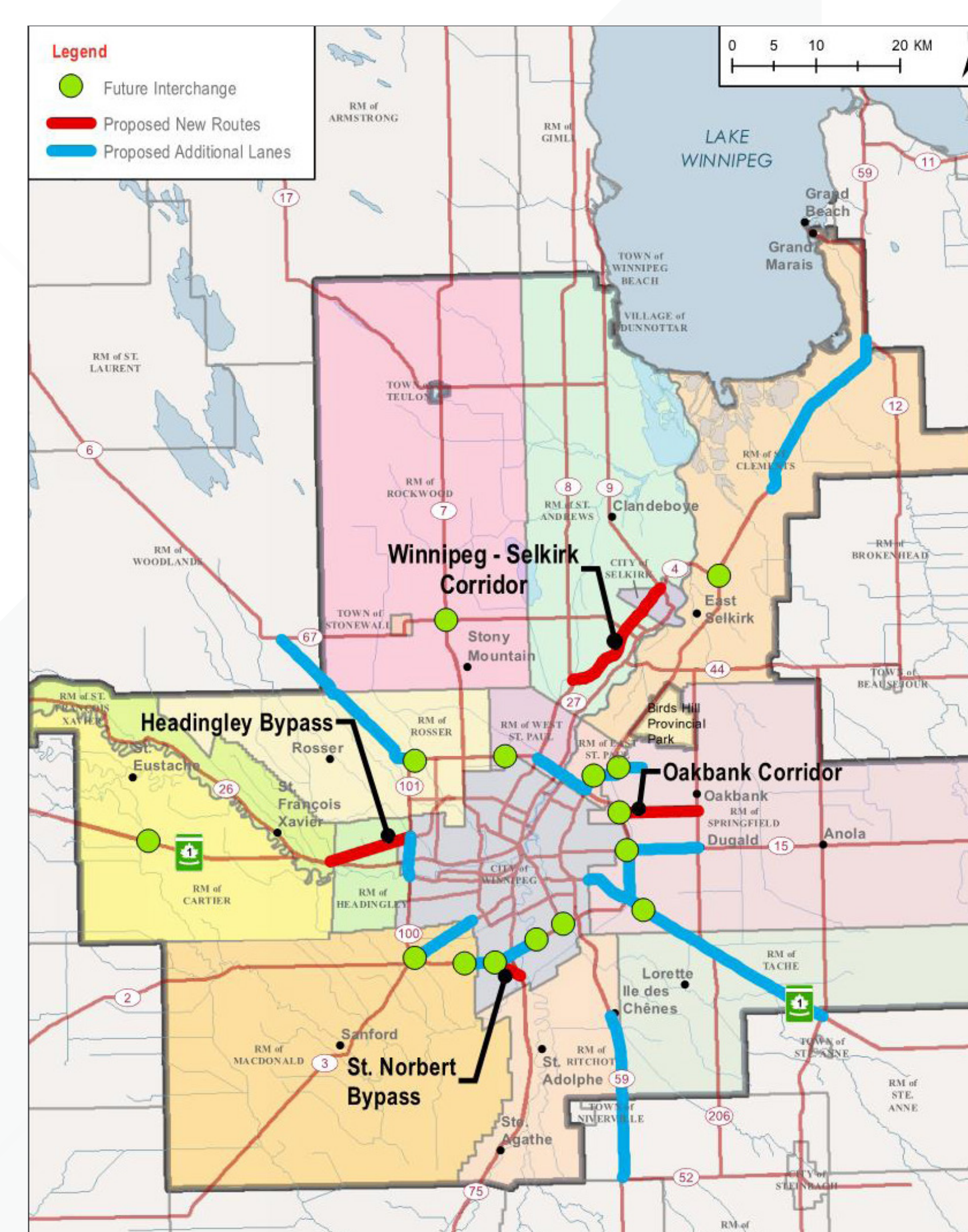
Aménagement futur des voies publiques